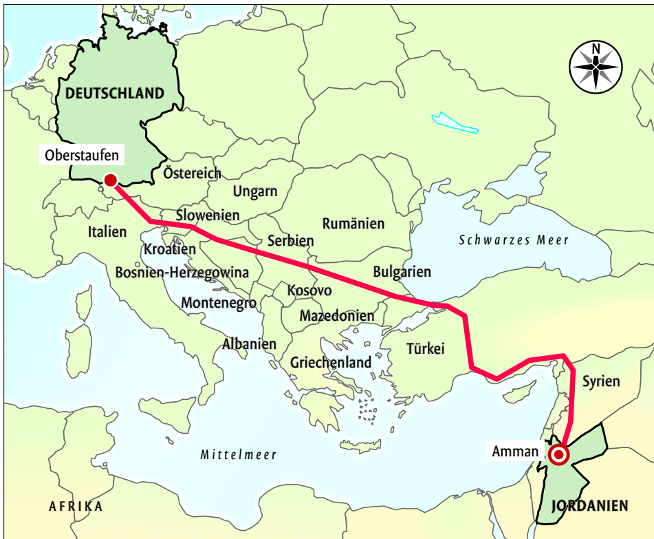
Eine mögliche Fahrstrecke nach Jordanien: Die Rallye-Teilnehmer können die Route selbst wählen, dürfen aber keine Autobahnen und Mautstraßen nehmen StN-Grafik: Lange

Die Teilnehmer der 5. Rallye Allgäu-Orient stammen meist aus Deutschland, aber auch aus Österreich, der Schweiz und 13 weiteren Ländern. Zehn Teams sind in der Region Stuttgart zu Hause – so wie die Wüstensterne, die mit insgesamt drei Fahrzeugen und sechs Abenteurern dabei sind. Oder die Benztown-Beduinen, die das größte Kontingent im Feld stellen: sechs Autos und zwölf Piloten, darunter zwei Frauen.